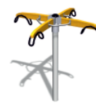
Kolotoč Twist 112350