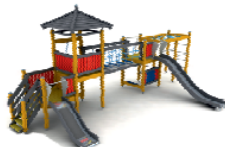
Multifunkční sestava Q01217